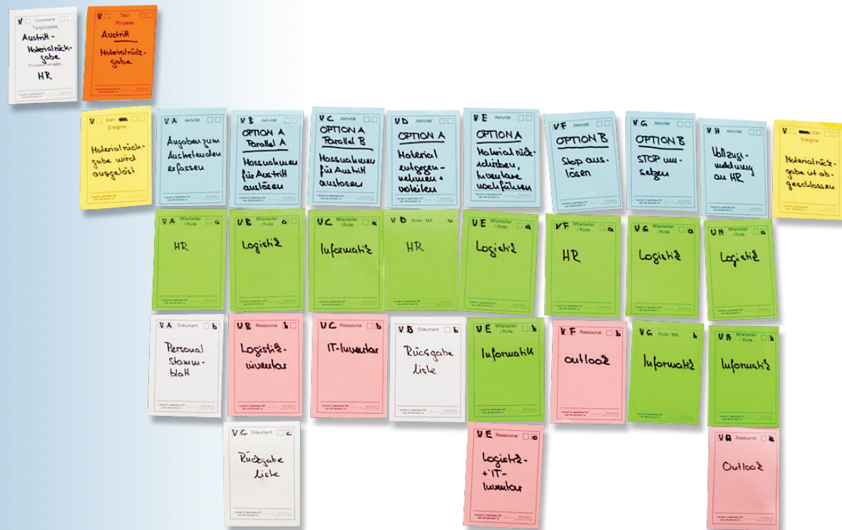
Beispiel: Austritt von Mitarbeitenden (vereinfacht)

■ Startereignis, Endergebnis ■ Aktivitäten ■ Ausführende □ Papierunterlagen ■ Ressourcen ■ Coverkarte